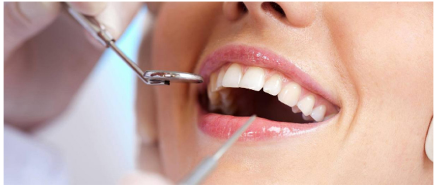
مرطوب کننده هوا می‌تواند سرمایه‌گذاری خوبی باشد.

خشکی دهان می‌تواند به واسطه سطوح رطوبت شکل بگیرد. زمانی که سطوح رطوبت هوا کم است، هوای خشک می‌تواند موجب خشک شدن غشاهای مخاطی شده و خشکی دهان را در پی داشته باشد. مرطوب نگه داشتن دهان و بینی ضروری است تا از این طریق احتمال سرماخوردگی، آنفلوآنزا و آلرژی‌ها کاهش یابد. از این رو، خرید یک دستگاه