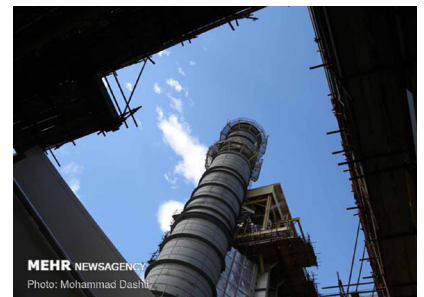
MEHR NEWSAGEN Photo: Mohammad Dastghaib

مدیرکل دفتر بودجه و تأمین منابع شرکت برق حرارتی گفت: قیمت گواهی ظرفیت از ابتدای سال آینده به منظور کنترل بازار و جلوگیری از تبعات ناشی از رشد یکباره افزایش خواهد یافت.